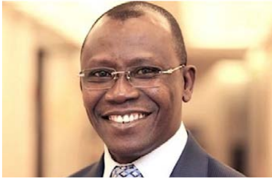
Sani Yaya, ministre togolais de l'Économie et des Finances