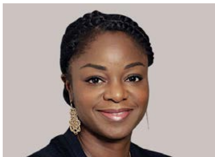
Cina Lawson, ministre de l'Economie numérique et de la Transformation digitale

La digitalisation est au cœur de la feuille de route gouvernementale. 75% des projets de cette feuille de route s'appuient sur la digitalisation des processus et des services. Le Togo veut moderniser et digitaliser son