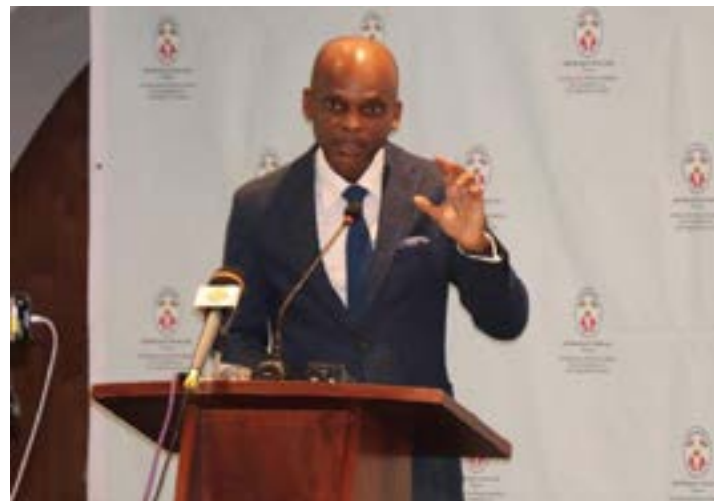
Professeur Robert Dussey

de notre pays dans la résolution de la situation sécuritaire catastrophique qui prévaut toujours dans les pays du Sahel. Le Togo ne peut même pas se permettre de rester inactif face à une telle situation, sous prétexte que notre territoire est jusqu'alors